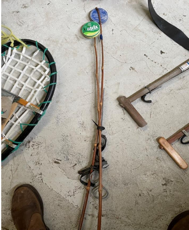
Mynd 17 Bambus stika. Bambus prik með kremdósum.