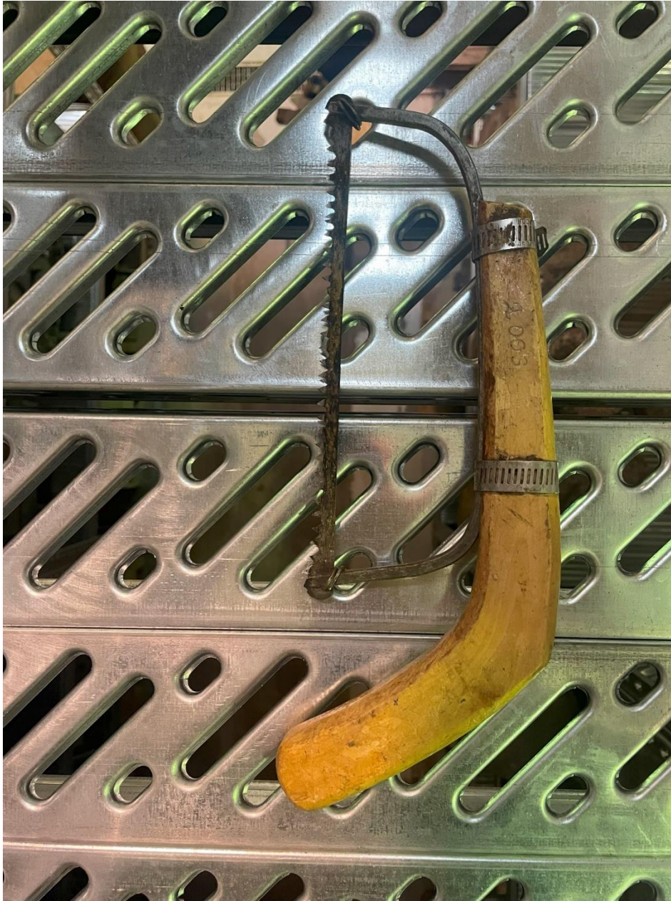
Mynd 31 Sög. Sög úr timbri og járni.