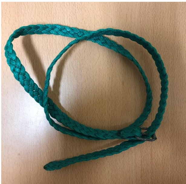
Mynd 9 Fléttað belti Belti sem eflaust hefur haft fjölbreytt notagildi. Sylgjan á því er einnig heimasmíðuð.