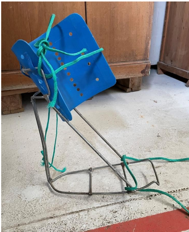
Mynd 20 Spelka. Ekki er hægt að ímynda sér annað en að þetta sé spelka. Gerð úr málm, hörðu bláu plasti og grænu bandi.