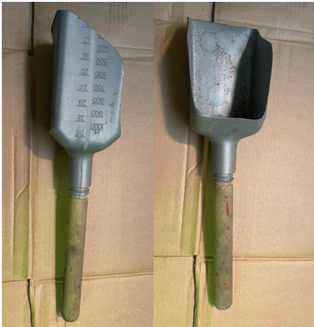
Mynd 12-14. Áhöld/verkfæri. Þrjú mismunandi áhöld búin til úr öðrum plast umbúðum og tréskafti.