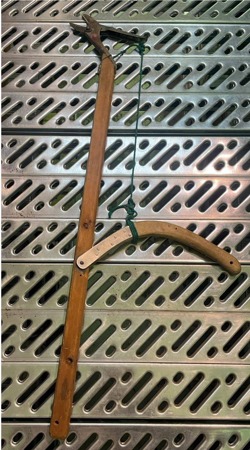
Mynd 27 Greinaklippa. Aðkeypt klippa sem hefur fengið viðbætur, maður getur ýmindað sér að það hafi verið gert til þess að komast hærra upp í tré og runna og klippa greinar.