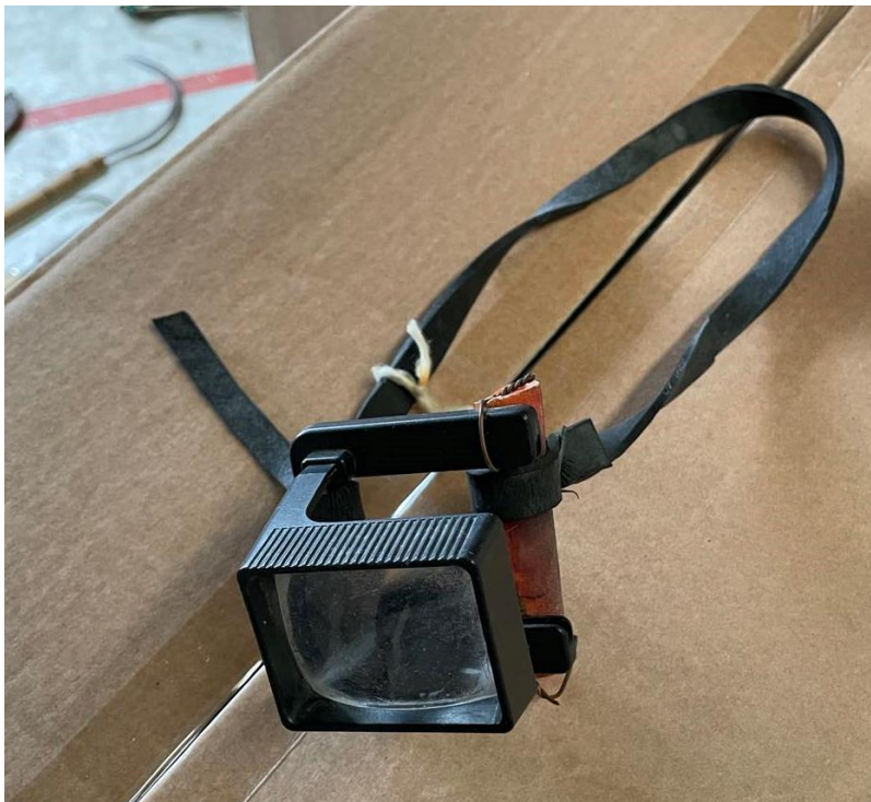
Mynd 18 Stækkunargler. Sterkt stækkunargler sem hægt er að festa á höfuðið til auðveldunar.