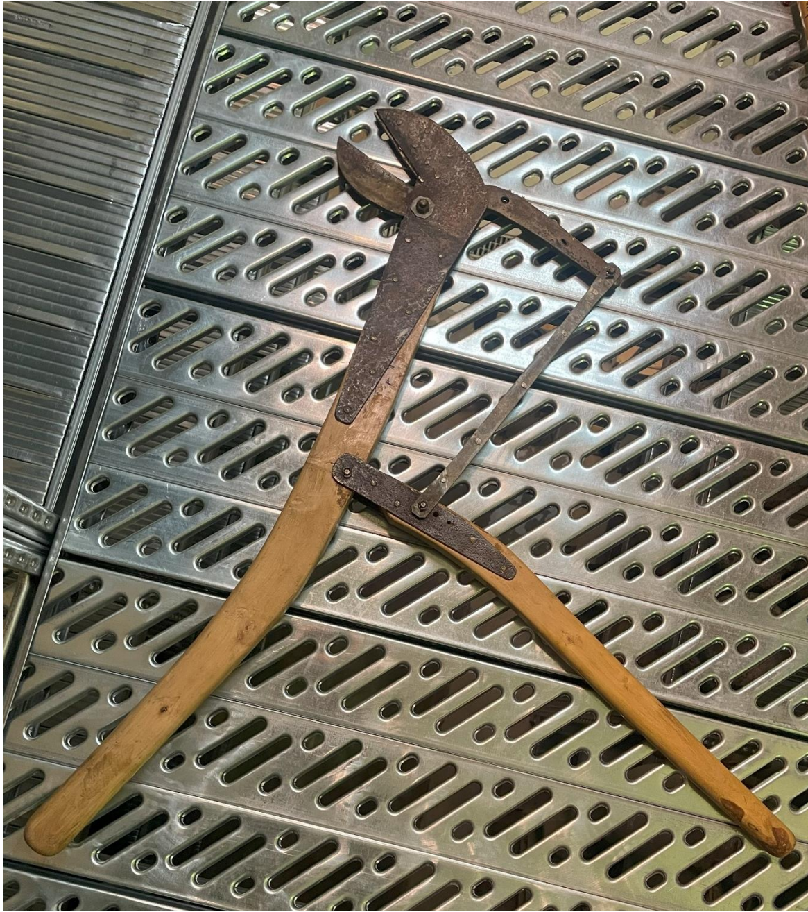
Mynd 28 Klippa. Klippa úr timbri og járni. Hún er mjög þung og hefur eflaust verið erfitt að nota hana upp fyrir sig.