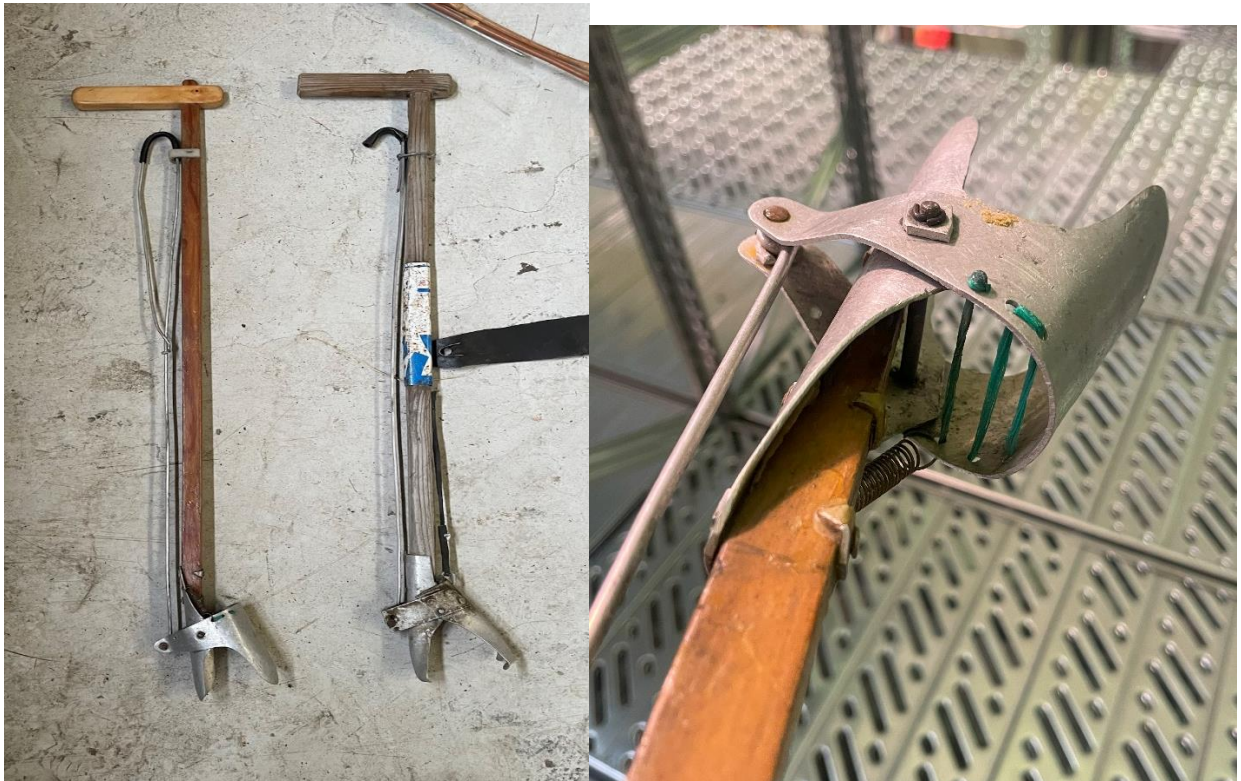
Mynd 2 Ruslatínslur. Þessar ruslatínslur fundust í geymslu MMH. Helgi hefur greinilega verið að prufa sig áfram með mismunandi efnivið við gerð tínunar.