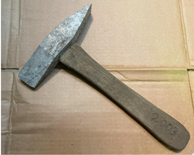
Mynd 25 Haki. Lítil haki eða öxi. Gerð árið 2003.