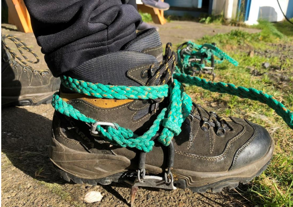
Mynd 4. Mannbroddar. Mannbroddarnir eru með þremur göddum og eru staðsettir undir miðjum skónum. Þeir eru léttir og fyrirferðarlitlir. Broddarnir eru festir með grænu féttuðu bandi um fótinn.