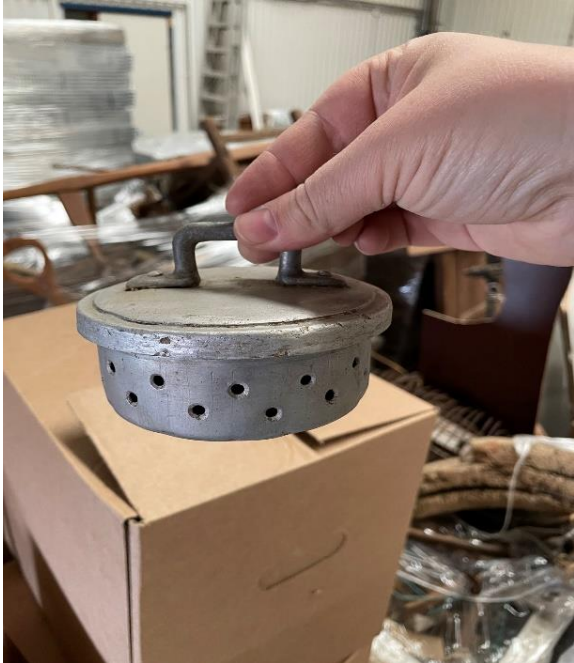
Mynd 15 Álpottur. Líttill álpottur með loki. Á pottinum eru göt, líkt og einskonar sigti