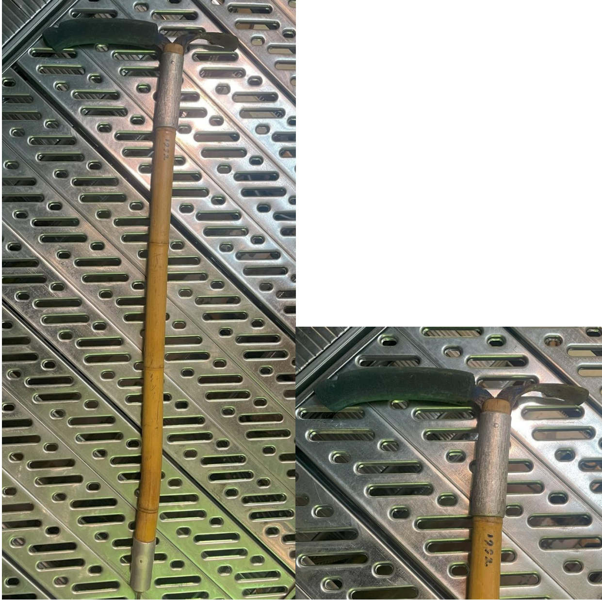
Mynd 26 Ísöxi. Ísöxi úr bambus, járni og áli með broddi á endanum líkt og brodd stafir eru. Gerður árið 1992.