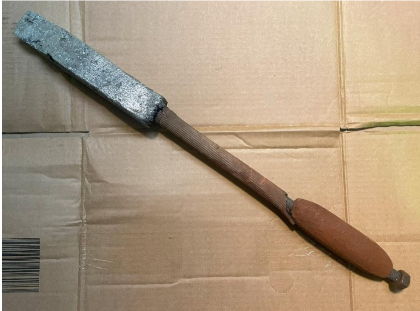
Mynd 25 Járnkall. Lítil járnkarl, skaftið er klætt með gúmmí.