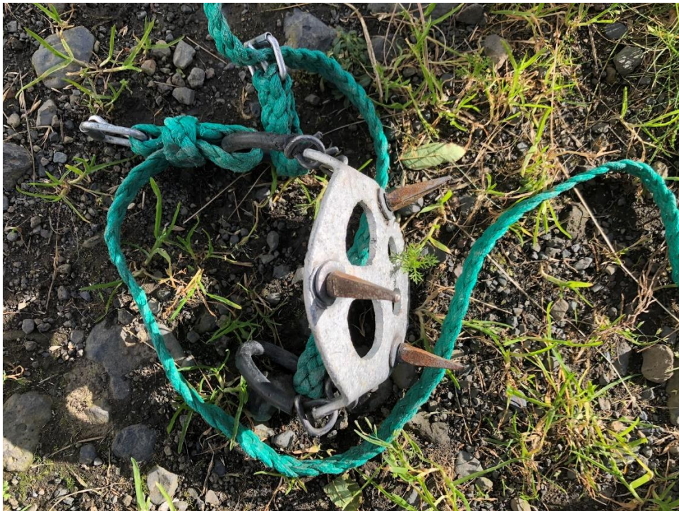
Mynd 5 Mannbroddar. Þrjú broddar líklega úr járni eða öðrum sterkum málmi eru festir á léttu málmplötu, líklega úr áli. Enn þann dag í dag eru sambærilegir broddar teknir með þegar Öræfingar þurfa að þvera skriðjökla, t.d í tengslum við smalamennsku.