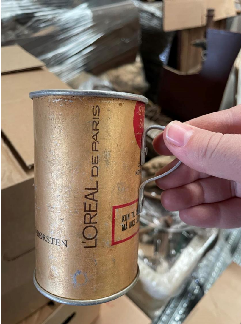
Mynd 24 Bolli. Ál mál úr Loreal brúsa.