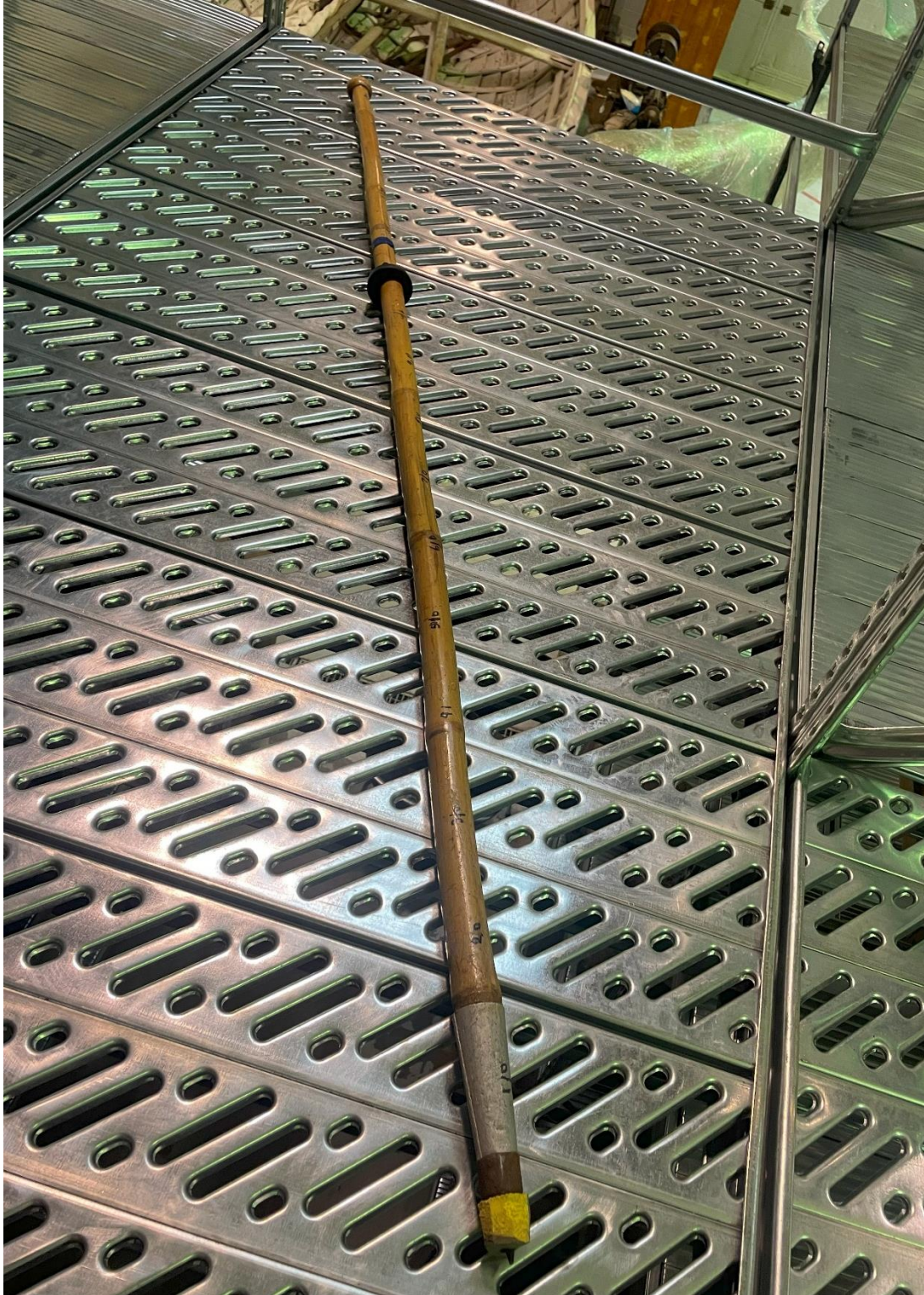
Mynd 30 Mælistika. Mælistika úr bambus með broddi úr járni og áfelli úr áli. Á stikunni eru mæli punktar. Gæti hafa verið nýtt til þess að mæla dýpt á vatni.