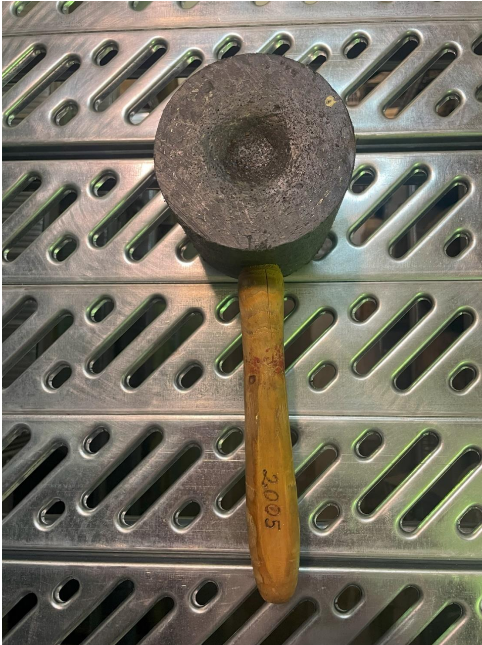
Mynd 29 Hamar. Hamar úr hörðu gúmmíi og með timbur skafti. Gerð árið 2005.