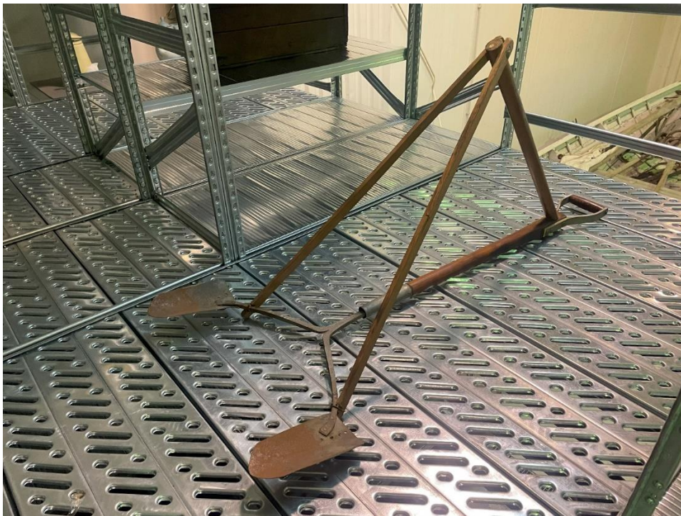
Mynd 23 Plógur. Verkfæri sem mögulega var nýtt við að gera rákir í jarðveginn í tenglum við sáningu eða gróðursetningu.