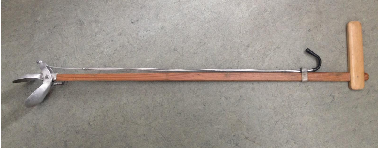
Mynd 1 Ruslatína. Landverðir í Skaftafelli fengu þessa ruslatínslu eitt sinn frá Helga. Að sögn fannst honum ekki gott að sjá landverðina alltaf vera að beygja sig eftir ruslinu.