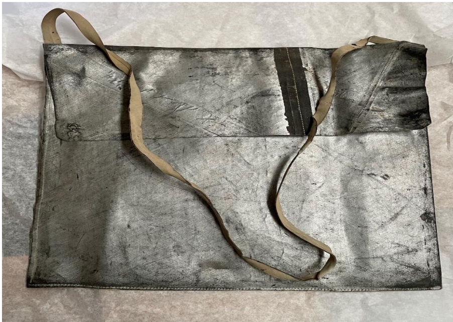
Mynd 16 Skjalataska. Í þessari tösku voru pappírar í A4 stærð. Samkvæmt munnlegum heimildum er taskan saumuð úr efni sem fékkst úr þýskum loftbelgi sem kom fljúgandi yfir Svinafellið og lennti í Hvannadal. Silfurlitaða belgnum var skipt bróðurlega á milli Örfæinga í kjölfarið. Að sögn voru Örfæingar í silfurlituðum regnfötum í kjölfarið. Þessi taska hefur líklegast verið saumuð á svipuðum tíma.