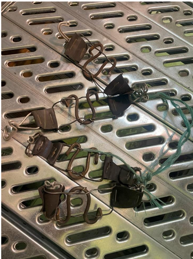
Mynd 7 Mannbroddar. Mannbroddar í geymslu MMH. Sambærilegir og á mynd 6.