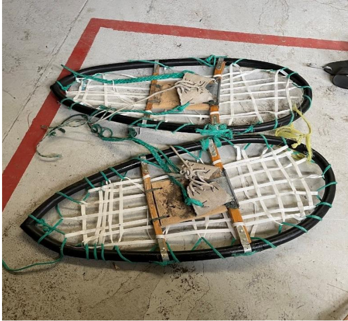
Mynd 19. Snjóþrúgur. Snjóþrúgurnar eru gerðar úr svörtu plaströri, plast böndum, timbri, málm og lérefti. Í geymslu MMH var einnig að finna snjóþrúgur sem komu líklegast frá Evrópu. Áhugavert að bera snjóþrúgur frá Kvískerjum saman við aðrar sjóþrúgur, búnar til úr öðrum efnivið en að öðruleiti mjög áþekkar.